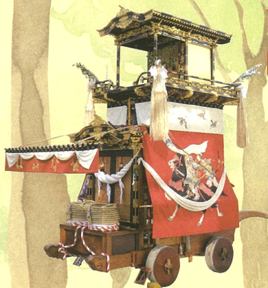
◎大幕 旧幕（大正十五年作）湊川の戦いにおける楠木正成と、如意輪堂の楠木正行を表現 ◎彫刻（明治三九年作）伊藤松次郎則光（名古屋）