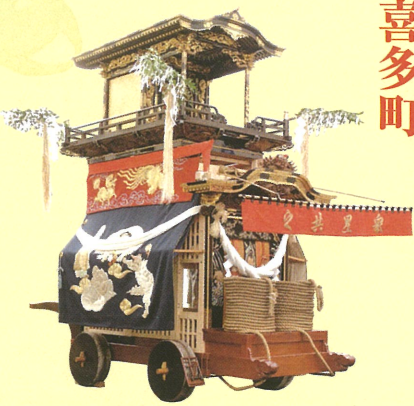
◎大幕（昭和五十年作）七福神を表現（旧幕は無地・天保二年制作） ◎彫刻（明治十四年作）瀬川重光（名古屋）