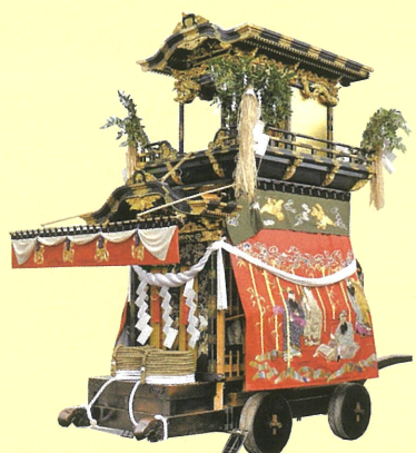
◎大幕 旧幕（明治二八年作）支那竹林の七賢人を表現 ◎彫刻 作者不詳

挙母祭り 挙母神社の例祭として寛永年間（1624～1643）の頃から、五穀豊穡を祈り行われていました。最古の記録としては、寛文四年（1664年）飾奉四輜（東町・本町・中町・神明町）、獅子舞（南町）後に傘鉦（西町・竹生町）とあり、寛延三年（1750年）には挙母藩の命により、従来の獅子舞を廃止し山奉を建造し始め安永六年（1777年）に南町・西町が翌年には北町（現・喜多町）・竹生町の飾り車ができ八輜となりました。この八輜の山車は、昭和三十九年（1964年）に愛知県の有形民俗文化財に指定されるとともに、豊田市の指定文化財にもなっています。掛け声と紙吹雪の中を山車が駆ける勇壮なさまは、三河の三大祭りに数えられ多くの人に親しまれております。