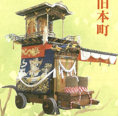
◎大幕 旧幕（明治三年作）源義経の八艘跳びと平教経の雄姿で、壇ノ浦の合戦を表現 ◎彫刻（文政二年作）二代 立川和四郎富昌（諏訪）