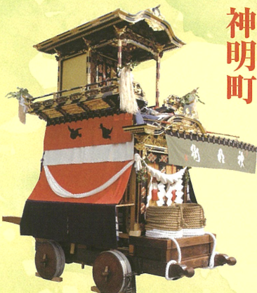
◎大幕 旧幕（天保二年作）祭神の不和童子の姿を白・赤・青の三段幕で表現 ◎彫刻（明治四四年作）瀬川鍋三郎（名古屋）