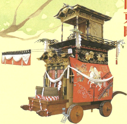
◎大幕 旧幕（嘉永二年作）中国の故事より張良が、師・黄石公の香を拾い、擗り、兵法の書を授かることを表現 ◎彫刻（天保六年作）早瀬長太郎（名古屋）