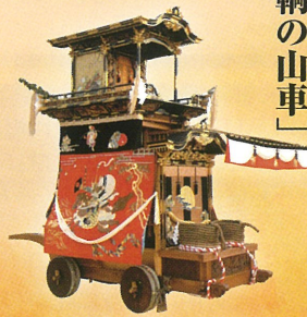
今年の華車・田南町

挙母まつりでは年ごとに八輦の先頭に立つ山車が入れ替わり、神社境内に最初に曳き込まれる車を華車と呼ぶようになりました。