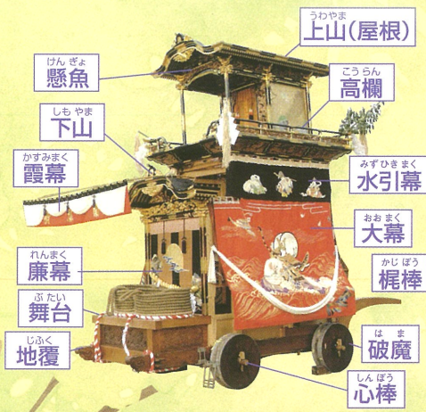
◎大幕 旧幕（嘉永二年作）源平の戦いにおける熊谷直実と平敦盛の姿を表現 ◎彫刻（安政二年作）瀬川重光（名古屋）

令和四年の華車である優美さが誇りの山車の祖形は宝暦2年（1752年）に造られ、安永5年（1776年）大改修された。