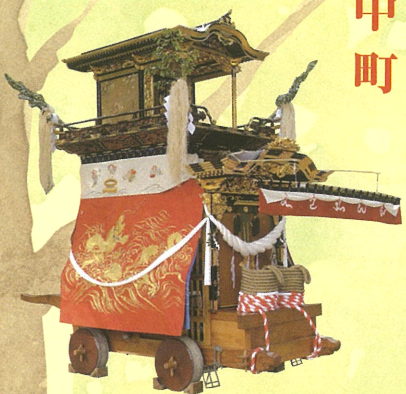
◎大幕 旧幕（天保六年作）神社東に「蛇の池」があったことから、波に竜を表現 ◎彫刻（大正十四年作）初代 村山群鳳（高山）