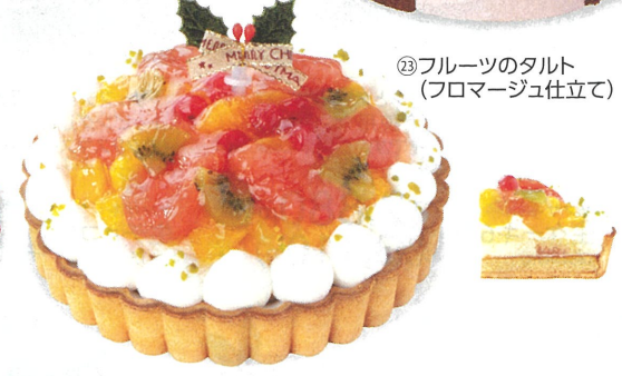
23 フルーツのタルト(フロマージュ仕立て)

21. タカキベーカリー Xmasファミリーアソート(約18cm) ¥2,980円 (¥3,218円) 特定原材料7品目 小麦 卵 乳