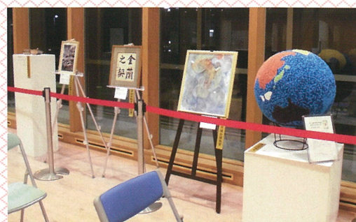
▲昨年の優秀作品の展示 (豊田市役所 東庁舎1階ロビーにて展示)

審査員によって選ばれた 5賞の作品 を展示します。 ぜひこちらにもお越しください！