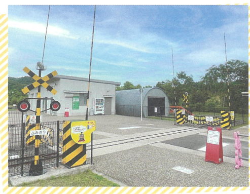
遊園ゾーンにある、子どもたちに大人気の踏切

柴田 『ふみきりくん』です。センター内に踏切があるのですが、「家の近くに踏切がないのでセンターまで見に来ました」という踏切好きの子たちがたくさんいて、とても人気だと感じています。