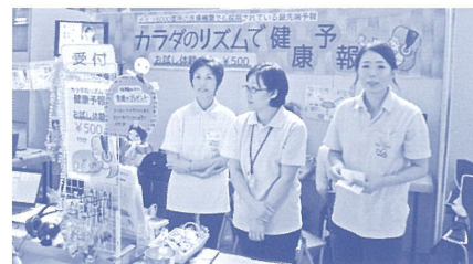
2コマ分のスペース