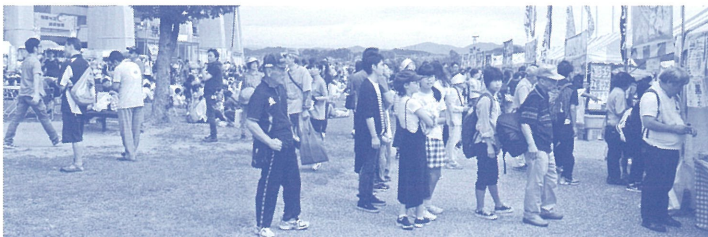
昼時のランチマーケット 各店に来場者が並ぶ