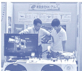
1コマ分のスペース