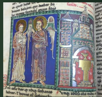
(アロヨ写本) 13世紀前半?