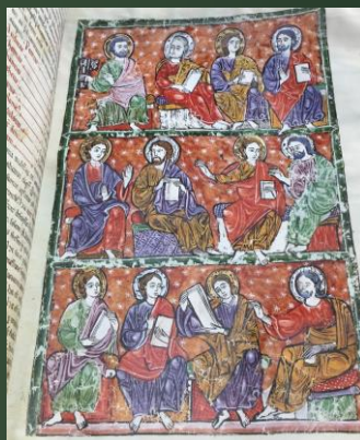
(ラス・ウェルガス写本) 1220年