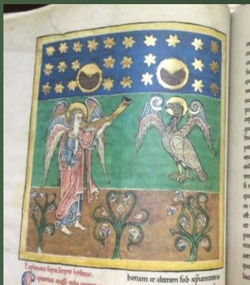
(カルデーニャ写本) 1175 - 85年