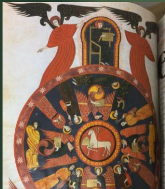
(ファクトゥス写本) 1047年頃