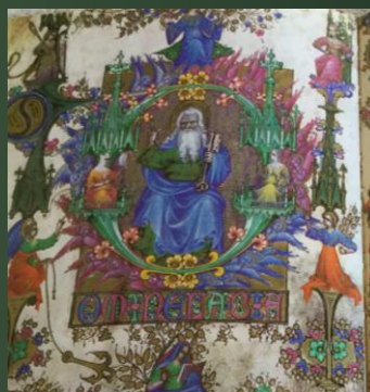
(ヴェイスコティ時禱書) 14-15世紀