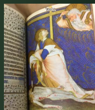
(ローアン時禱書) 1430-35年