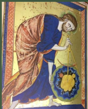
(道徳聖書(教訓聖書)) 1220-30年